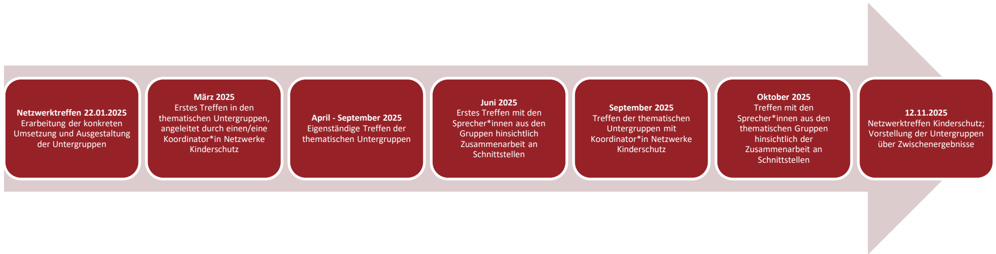
Abbildung 1 Zeitplanung Jahr 2025